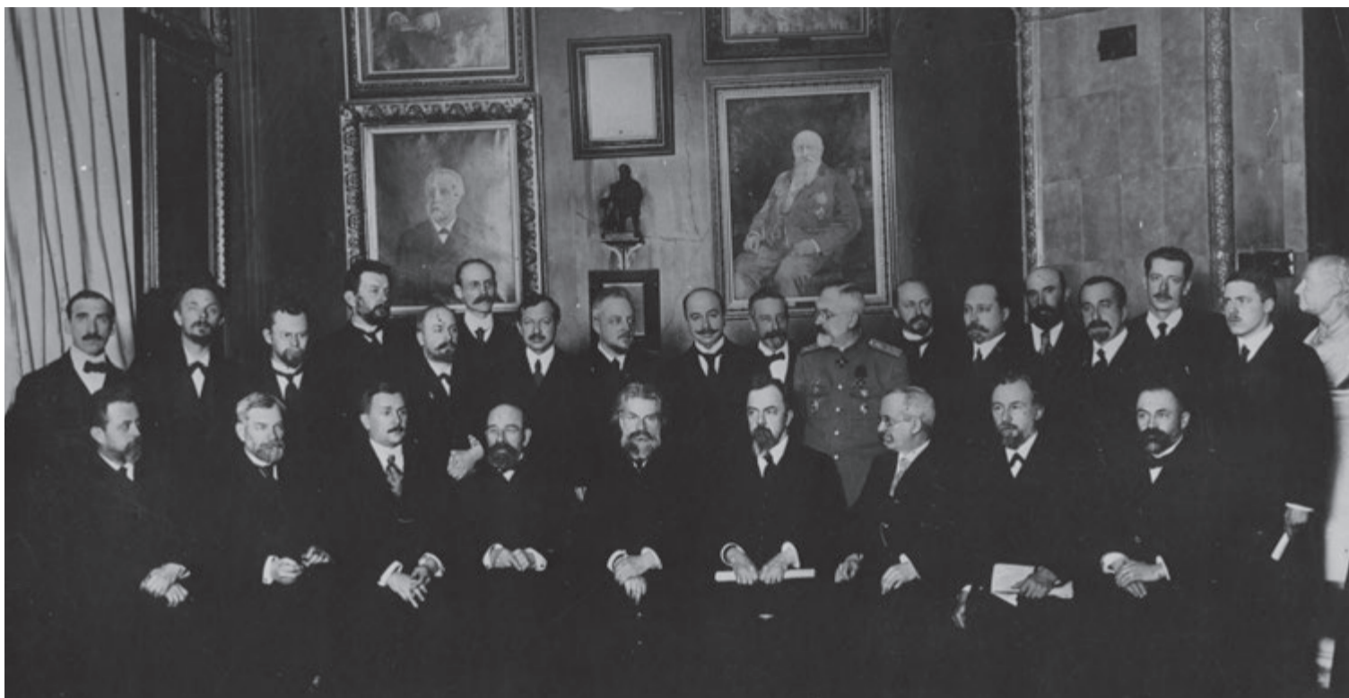
Члены-основатели Русского ботанического общества на Учредительном съезде, 20-21 декабря 1915 г.